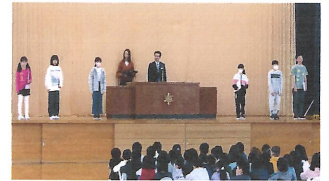
認証状授与の様子